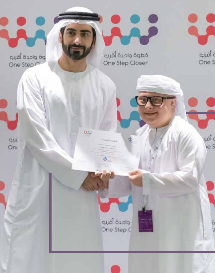
تحقيق: حازم ضاحي شحادة

نجاح ملموس شهدته قمة المناصرين الذاتيين الأولى على مستوى دولة الإمارات العربية الشقيقة، والتي نظمتها مدينة الشارقة للخدمات الإنسانية في الفترة من 27 - 30 سبتمبر 2019 تحت شعار (خطوة واحدة أقرب) بالتعاون مع منظمة الاحتواء الشامل لإقليم الشرق الأوسط وشمال أفريقيا وبمشاركة 14 مناصراً ذاتياً ومسانديهم و9 أمهات.