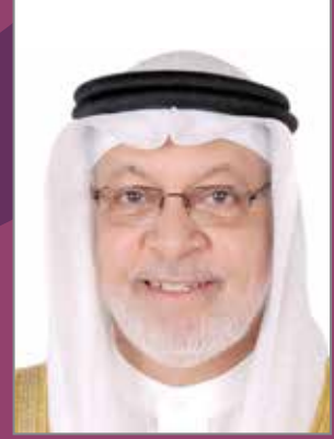
معالي الشيخ دعيج آل خليفة آل خليفة

لقد كشف تقرير «حالة الأمن الغذائي والتغذية في العالم لعام ٢٠١٩م»، إلى أمور غاية في الأهمية، في مقدمتها: أولاً: تناقص الأمن الغذائي في دول مجلس التعاون نظراً للطبيعة الجغرافية والمناخية التي تقلل مساحات الزراعة، وثانياً: ارتفاع أعداد الجياع حول العالم حيث بلغ عدد الأشخاص الذين يعانون من الجوع المزمن نحو ٨٢١ مليون شخص في ٢٠١٨. وإذا كانت مناطق جغرافية أخرى في العالم تعاني من الجوع بما يؤثر بشدة على ذوي الإعاقة، فإن منطقتنا تحتاج إلى التوعية بالغذاء الصحي للجميع وترشيد الإستهلاك، حتى لا يؤدي إنتشار وتزايد السمنة إلى المزيد من الأمراض، للأصحاء وذوي الإعاقة سواءً بسواء.