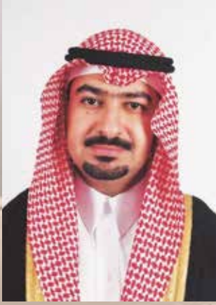
بقلم: د. ياسر بن محمود الفهد والد شاب توحدني - الرياض